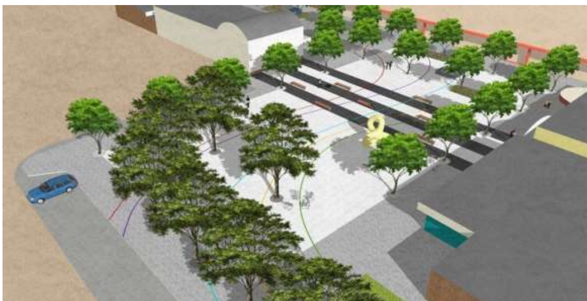
Studie náměstí – prostor mezi poštou a firmou AG COM